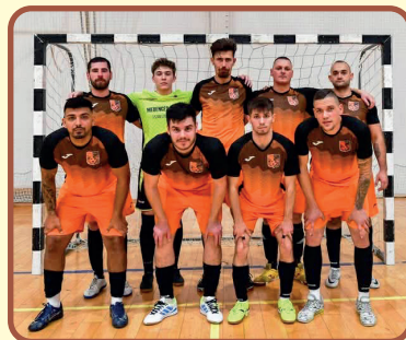
A futsal 4es döntős csapata