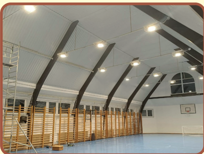
Tornaterem világítás korszerűsítés