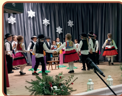
Óvodások műsora Idősek Karácsonyán