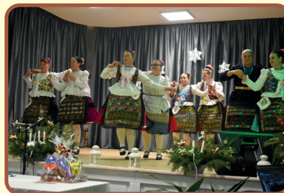
Új Gyöngyösbokrétások tánca