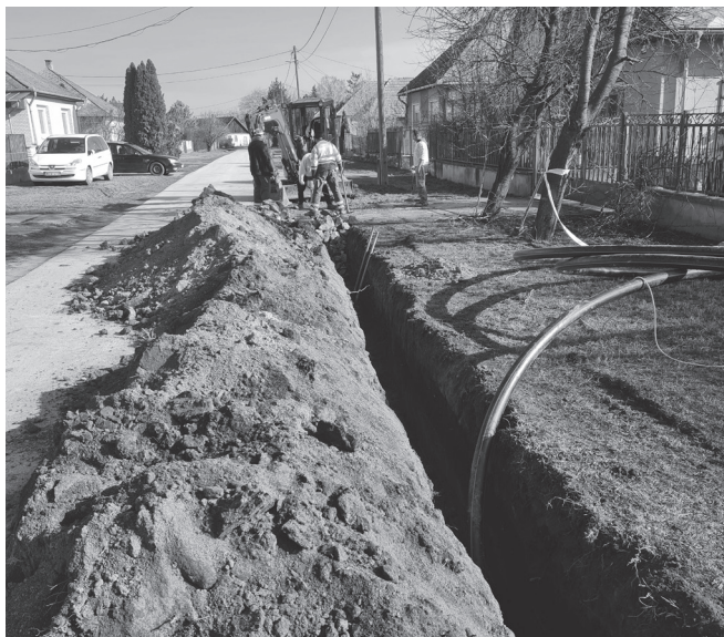
Ivóvízhálózat rekonstrukciós munkái az Ady Endre és Zrínyi utcában

Továbbra is a legfontosabb szempontok figyelembevételével alapvetően az intézmények, szolgáltatások biztonságos működtetésére, a működési bevételek és kiadások egyensúlyára törekedtünk.