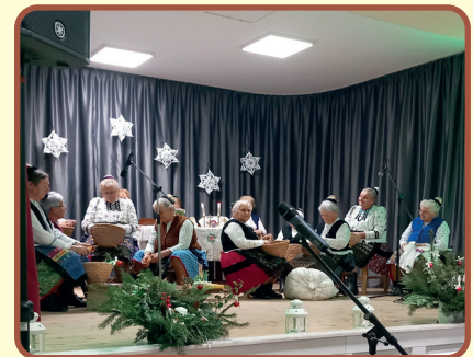
Asszonykórus: „Kemence melege” c. előadása