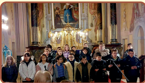
Falukarácsonyi műsor a templomban