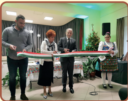
Járdaátadó az Idősek Karácsonyán