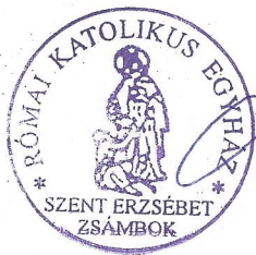
Mészáros Csaba plébános